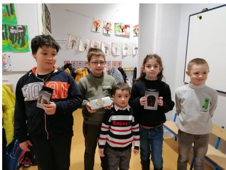
Les meilleurs vendeurs de chocolats de Noël de l'école récompensés