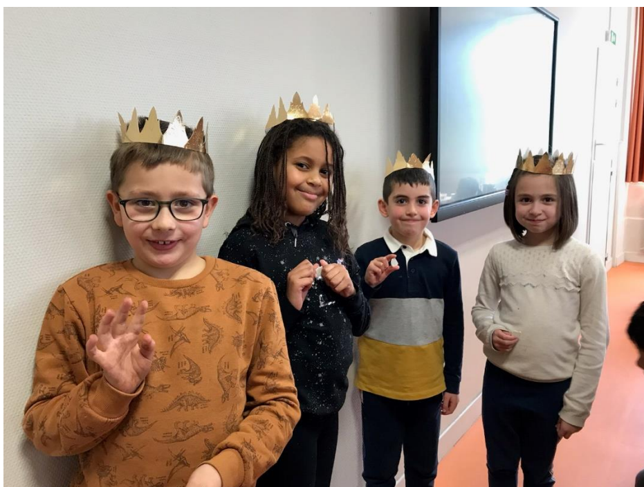
Voici les rois et les reines du jour