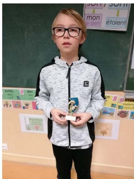
Les sportifs récompensés