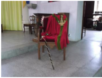
Trône du roi Hérode