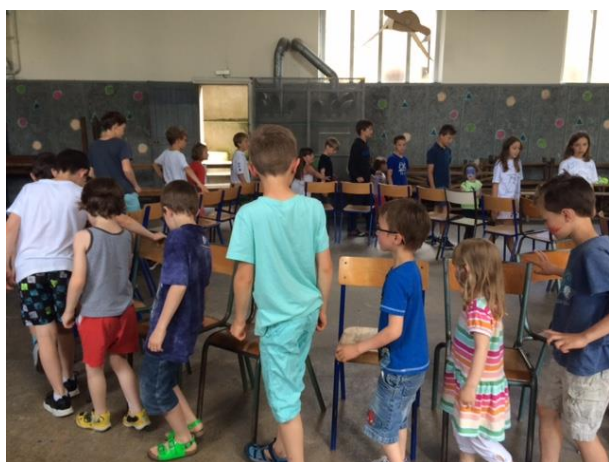
Les chaises musicales