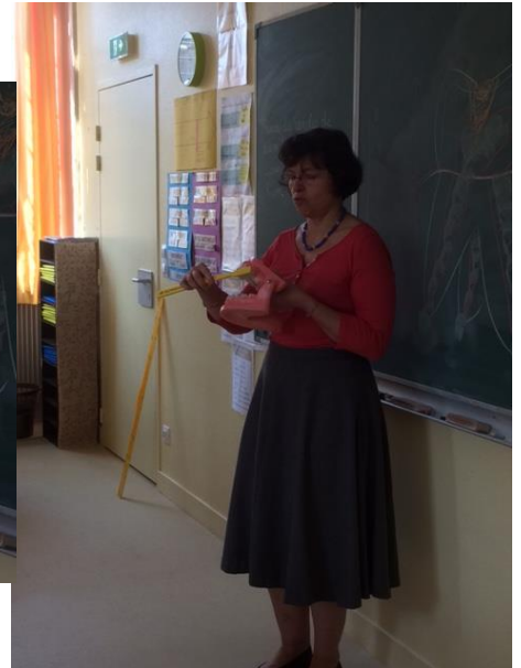
Brossage de dents