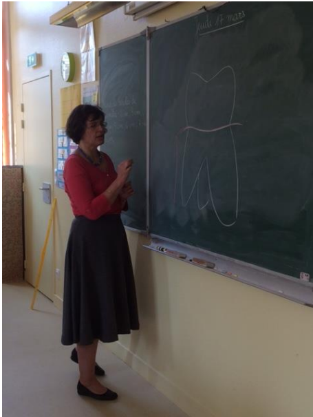
Schéma d'une dent

Le jeudi 17 , nous avons eu l'intervention d'une dentiste. C'était très intéressant.